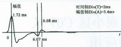
图 2 316# 桩低应变完整性检测曲线